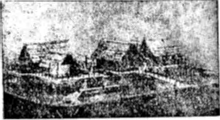
صورة أكلها المصور بخياله للمنازل التي بقيت آثارها تحت ماء البحيرات السويسرية من عصور ما قبل التاريخ

وفي عام ١٨٥٤ حيث كان الشتاء من الجفاف بدرجة حارقة للمألوف ، هبط مستوى الماء في البحيرات السويسرية ، فكشف عن عصر آخر من عصور ما قبل التاريخ ؛ فوجدت أكوام فيما يقرب من مائتي موضع في هذه البحيرات ؛ ووجد أن هذه الأكوام ظلت مكانها تحت الماء زمنا يتراوح بين ثلاثين قرنا وسبعين ؛ ولقد كانت تلك الأكوام مصفوفة