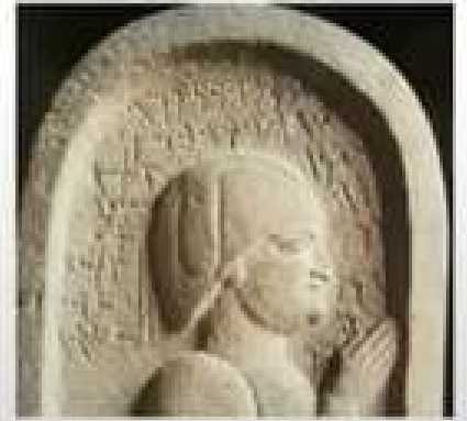
الكتابة الآرامية من القرنين السابع والثامن قبل الميلاد