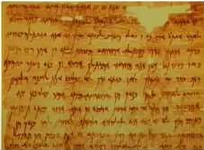
كتابات آرامية من الملك الفارسي في القرن الخامس قبل الميلاد عثر عليها في مصر